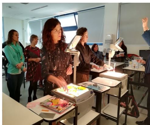
Outro aspeto das sessões paralelas (“A linguagem da arte e a valorização do trabalho interdisciplinar”).