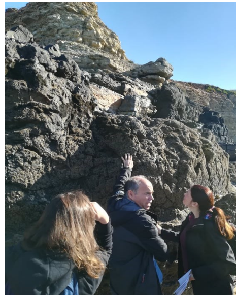
“Educação Ambiental...”, formação em Ribeira d'Ilhas, Ericeira.